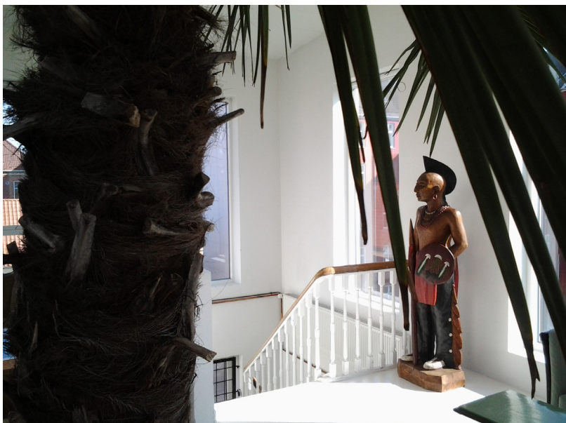
Op ad trappen til 2. sal og du bliver modtaget af indianer og palme.