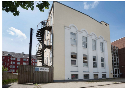
Bispevej 25, øverste etage, det er Fatamorgana.

Skolen købte 2015 ejerlejligheden Bispevej 25 2.tv. et studie med masser af lys og udsigt over København. Et stort rum kun opdelt af reoler og forhæng. Der er køkken med spiseplads, hyggeshjørne, undervisningstavler, computere, skannere, printere, studiebibliotek, værksted og gæstroom med spindeltrappe. Omkring en palme midt under ovenlyset holdes fællesmøder. Til lejligheden hører en gård med plads til ophold udendørs, når vejret er til det.