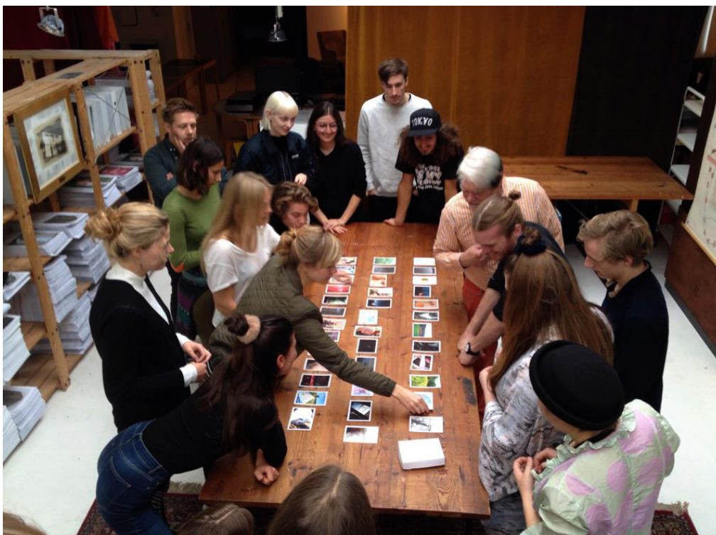
Fotograf Morten Bo giver med eleverne kritik af den foreløbige skitse til et projekt. Oktober 2015